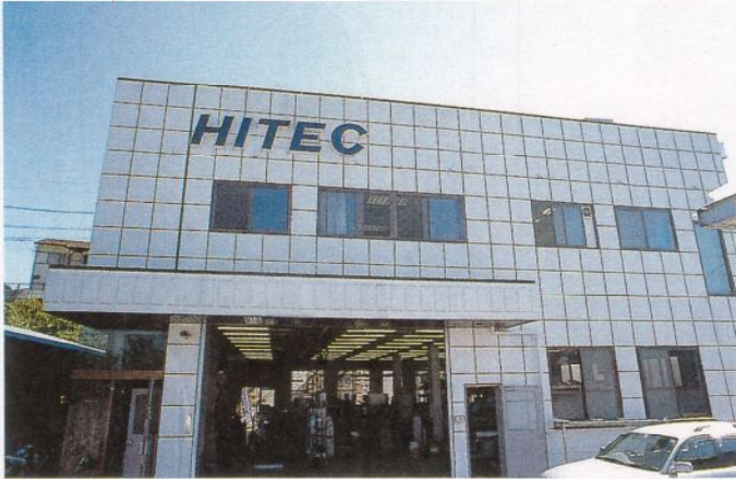
本社工場 開発と試作機の製造を行い、現在はファブレス化により製品を作っている。