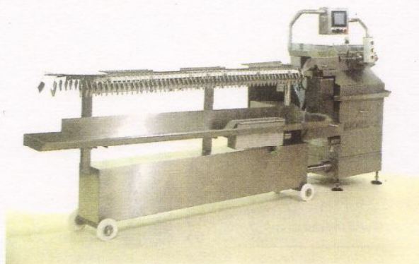
天然腸ソーセージ定寸充填機「マックウェル」。均一な重さと長さの天然腸ソーセージを、最大で毎分800個製造する。